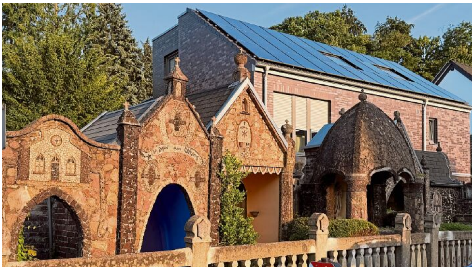
Die außergewöhnlichen Kapellen wurden vor 100 Jahren in Frechen Königsdorf gebaut.

Für Verpflegung während des Workshops werde gesorgt und eine Spendendose aufgestellt. Der Workshop findet am Freitag, 19. Juni, von 15 bis 21 Uhr in der Pfarrkirche, Franz-Busbach-Straße, statt. (otr)