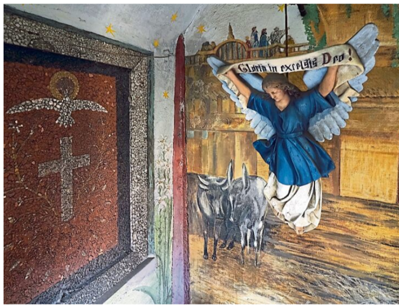
Aus der Rosenkranzkapelle stammt diese Aufnahme der liebevoll und mühsam gestalteten Wände.

Die Arbeit an Sachbüchern und die Recherche ist für Zey nichts Neues. Nach seinem Studium der Germanistik und Philosophie war er lange als Lektor tätig – unter anderem auch bei Bastei Lübbe und DuMont. Von 1991 bis zum Ruhestand war er dann Geschäftsführer des Königsdorfer Medienhauses. In