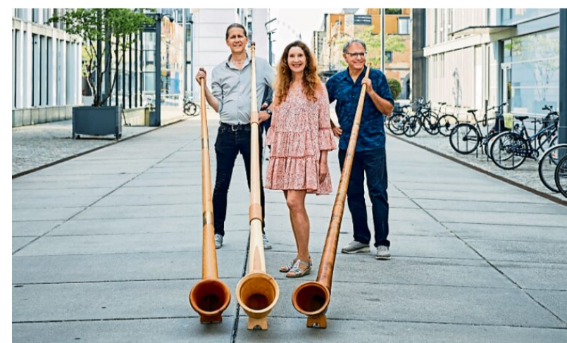
Alphörner und eine starke Frauenstimme sind das Markenzeichen von Alpcologne.